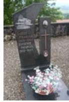
- Son monument funéraire à Estavannens