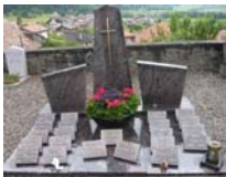
- Au columbarium d'Estavannens