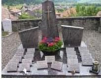
- Au columbarium d'Estavannens