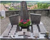
- Au columbarium d'Estavannens