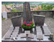
- Au columbarium d'Estavannens