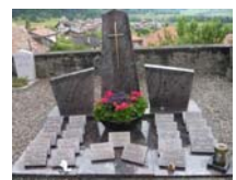
- Au columbarium d'Estavannens