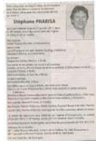
- Au columbarium d'Estavannens